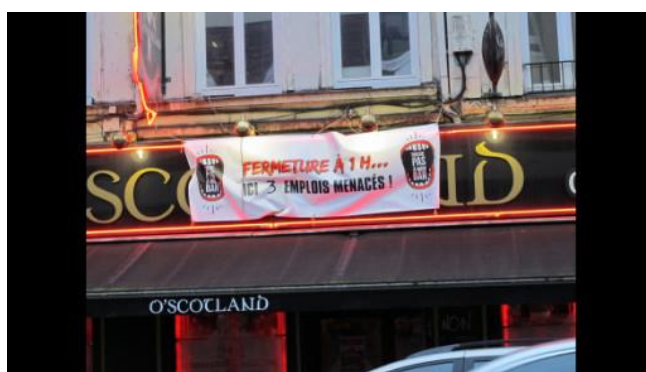
Trois emplois seraient menacés au bar O'Scotland, rue de Solférino, si la nouvelle charte de la vie nocturne est appliquée en l'état

« La Ville ne fait pas beaucoup d'efforts pour nous. Ils veulent faciliter les procédures de fermetures administratives lorsqu'il y a besoin, renforcer encore les patrouilles de police municipale.... Nous, on tente de revenir sur chaque point. »