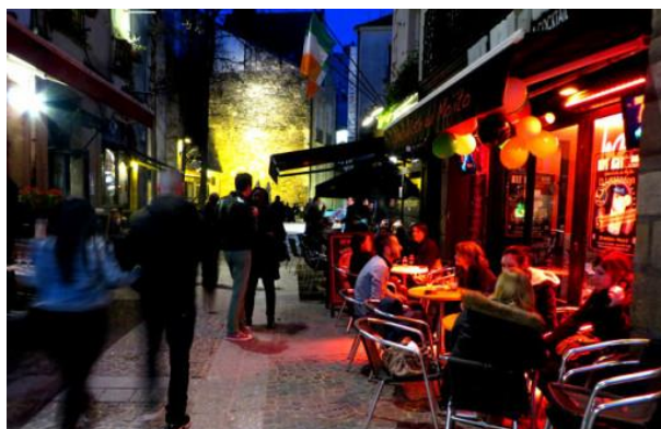
Un soir, dans le quartier du Bouffay à Nantes

Après l'hystérisation du débat sur la vie nocturne, Rue89 Strasbourg s'est demandé comment Toulouse, Rennes, Lille, Nantes et Clermont-Ferrand se débrouillaient. La formule magique pour une vie nocturne vivante et apaisée reste à trouver.