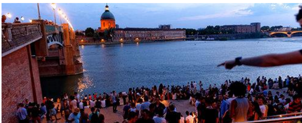
Les marches du Quai Saint-Pierre sont fréquentées par des centaines de personnes chaque soir en été.

Le but : lutter contre l'alcoolisation dans les rues de la ville rose, notamment sur les marches du quai Saint-Pierre, créés au printemps 2014 et fréquentées par 500 à 600 toulousains. Dans le département de la Haute-Garonne, l'usage régulier de l'alcool concerne 14% de la population contre 10,5% en France. Pour endiguer les accidents dus à l'alcool, la mairie a par exemple étendu les horaires du métro les vendredi et samedi jusqu'à 3 heures du matin, au lieu de 1 heure auparavant.